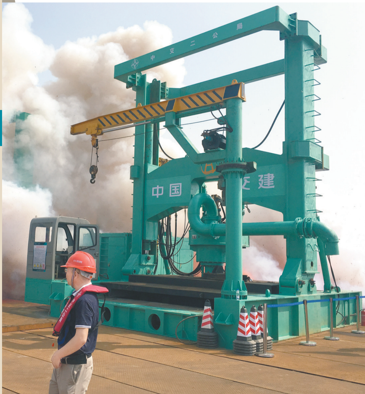
9月6日,深中通道桥梁工程主墩桩基开钻。