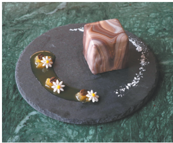
想太多(肉桂巧克力)