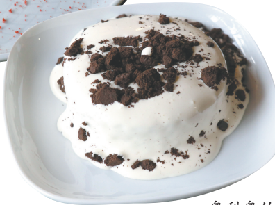
奥利奥竹炭爆浆蛋糕