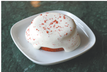
酸奶爆浆红丝绒蛋糕

法式慕斯爱得精致,满是小心思,但Psycho Lab也有两款爱得无法无天的浓情蛋糕,便是酸奶爆浆红丝绒蛋糕和奥利奥竹炭爆浆蛋糕。此时,爱情甜蜜期中的两人,眼中恐怕再无他人。