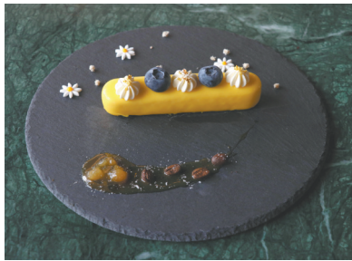
吃醋(柠檬草百香果)